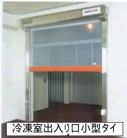
冷凍室出入口小型タイプ