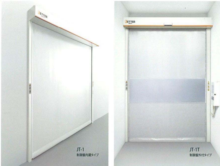
JT-1 制御盤内蔵タイプ