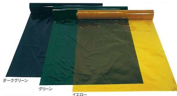
ダークグリーン グリーン イエロー