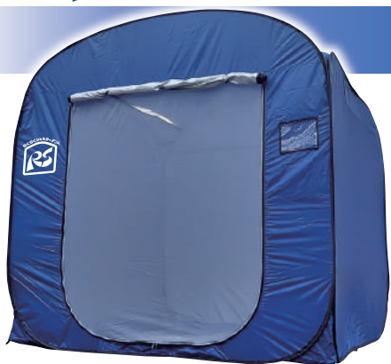
■ 出入口 (閉じた状態)